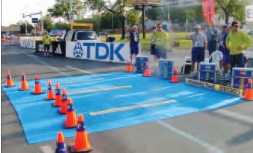
Alfombra para el sistema de transpondedores (chips).

puestos de esponjas, la mejor colocación es tener esponjas de tamaño medio en grandes recipientes de agua, y colocados en mesas de 1 metro de altura, de manera que sea de fácil acceso por parte de los asistentes y de los propios atletas.