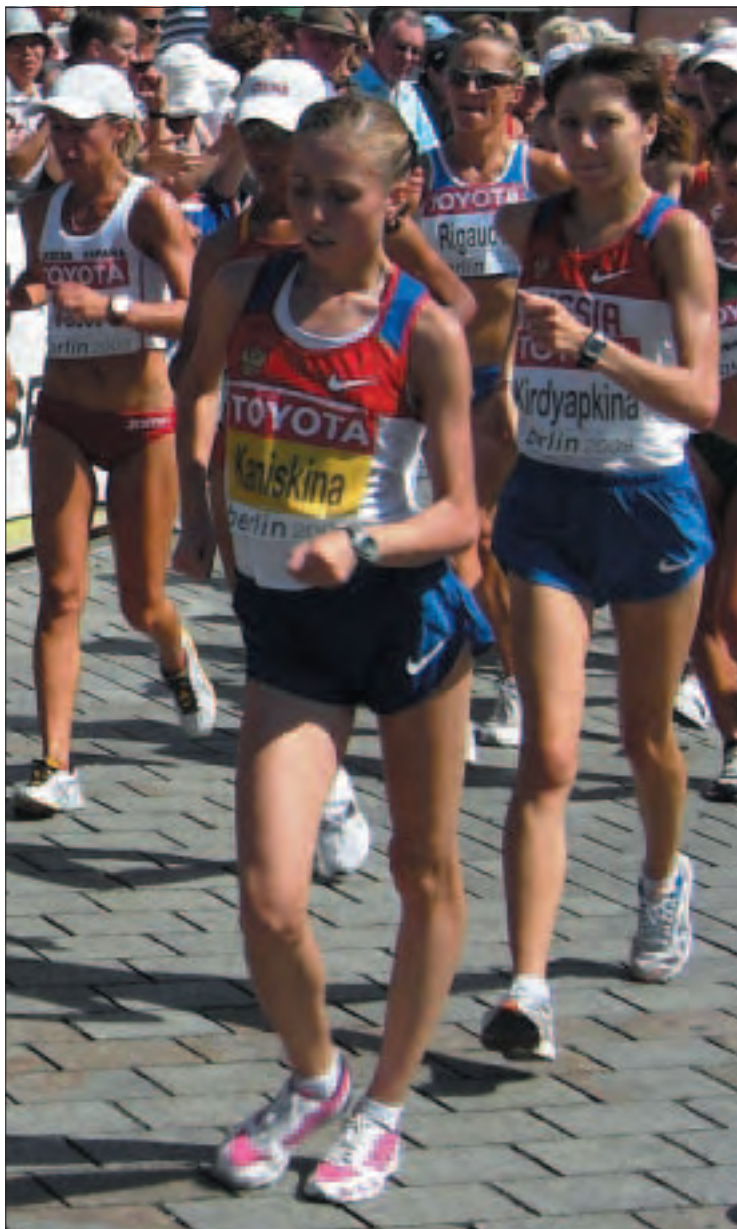
Olga Kaniskina, Championne Olympique 2008, Championne du Monde 2007-2009.