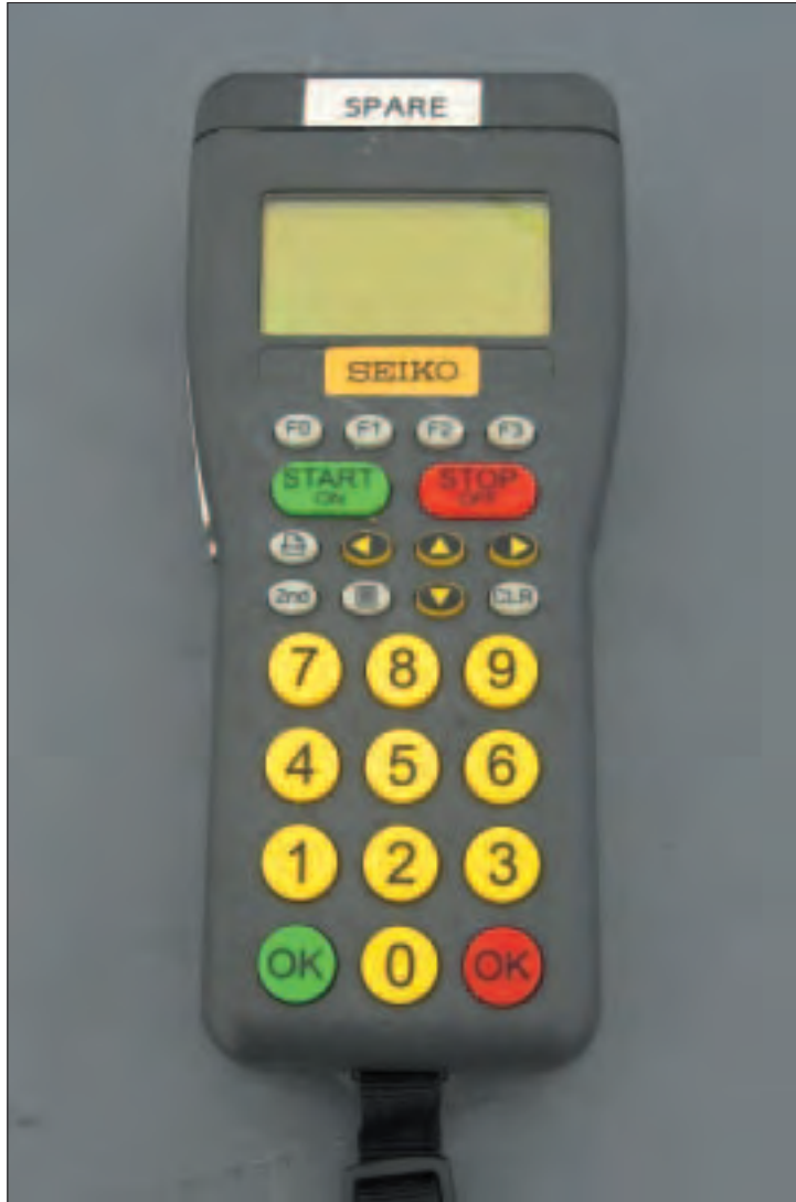
Terminal portable des juges.