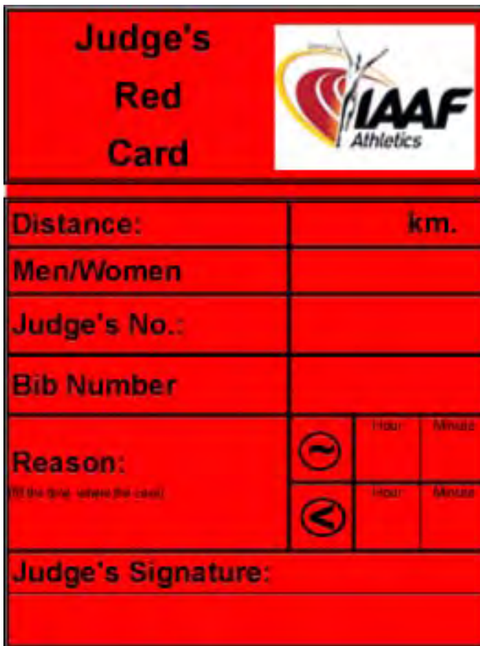
JUDGES RED CARD