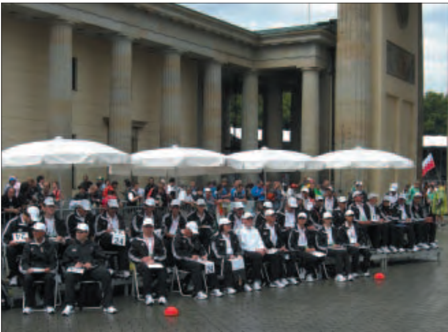
Jueces de cuenta vueltas en el IAAF Campeonato del Mundo, Berlín 2009.

Nota: Para las competiciones del artículo 1.1 (a) se ha desarrollado un sistema