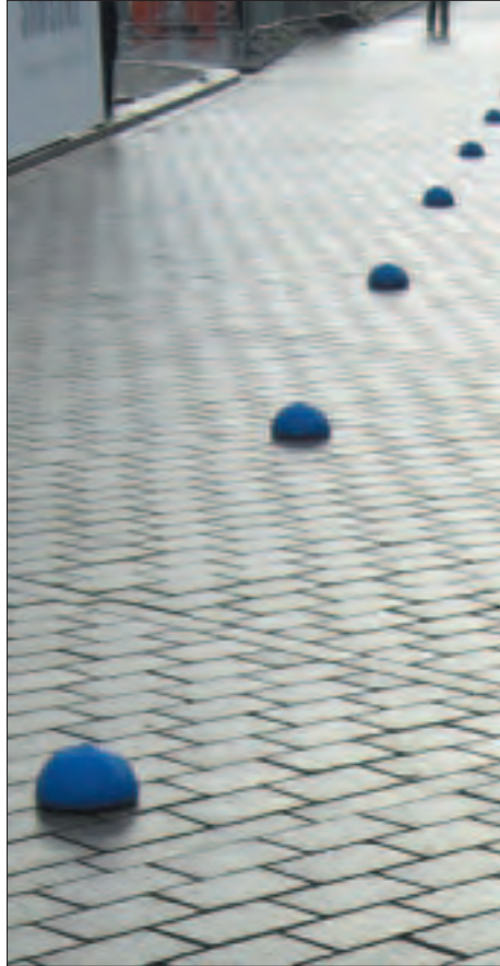
Cônes sur le circuit des Championnats du Monde d'Athlétisme de Berlin 2009.

En accord avec la règle 230.8 (a), le parcours doit être fermé aux spectateurs et aux véhicules, juste avant la première épreuve de la journée. Pour cela, il suffit d'utiliser des barrières, des cordes, des cônes, etc. Des Commissaires et des membres de la police assurent la sécurité sur le parcours, sur les aires d'échauffement, la zone du contrôle anti-dopage, etc. Il est tout particulièrement important d'empêcher les spectateurs et les véhicules de la télévision de bloquer la vue des Juges et de gêner les marcheurs. Les caméras de télévision ne sont autorisées sur le parcours que si elles sont montées sur un véhicule qui n'émet pas de gaz et qui reste, soit devant, soit derrière les marcheurs. La zone d'arrivée devrait être aussi dégagée, sauf pour les officiels sur la ligne d'arrivée. Personne n'est autorisé à se tenir devant le Tableau de Report des Cartons Rouges. Les postes de rafraîchissement/épongeage doivent également être dégagés de toute personne à l'exception des officiels responsables de ces zones.