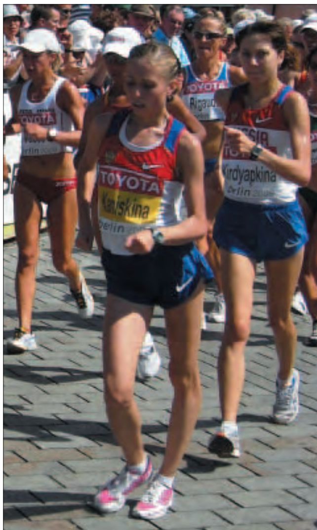
Olga Kaniskina (Russia), Olympic champion 2008, World champion 2007-2009.

help to improve standards of judging, thereby improving walking competitions and the sport of race walking around the world.