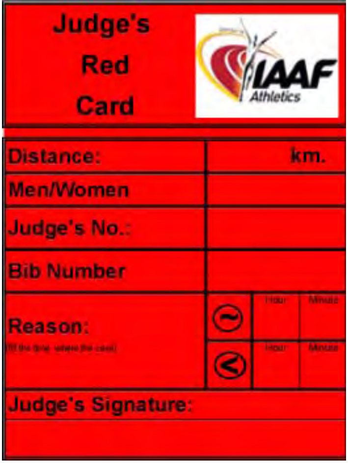
MODELO DE TARJETA ROJA