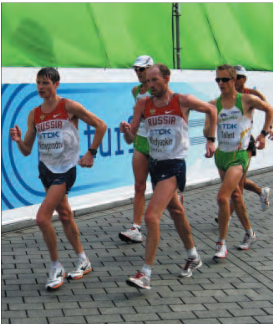
Leading group in the Men's 50kms at the IAAF World Championships - Berlin 2009.