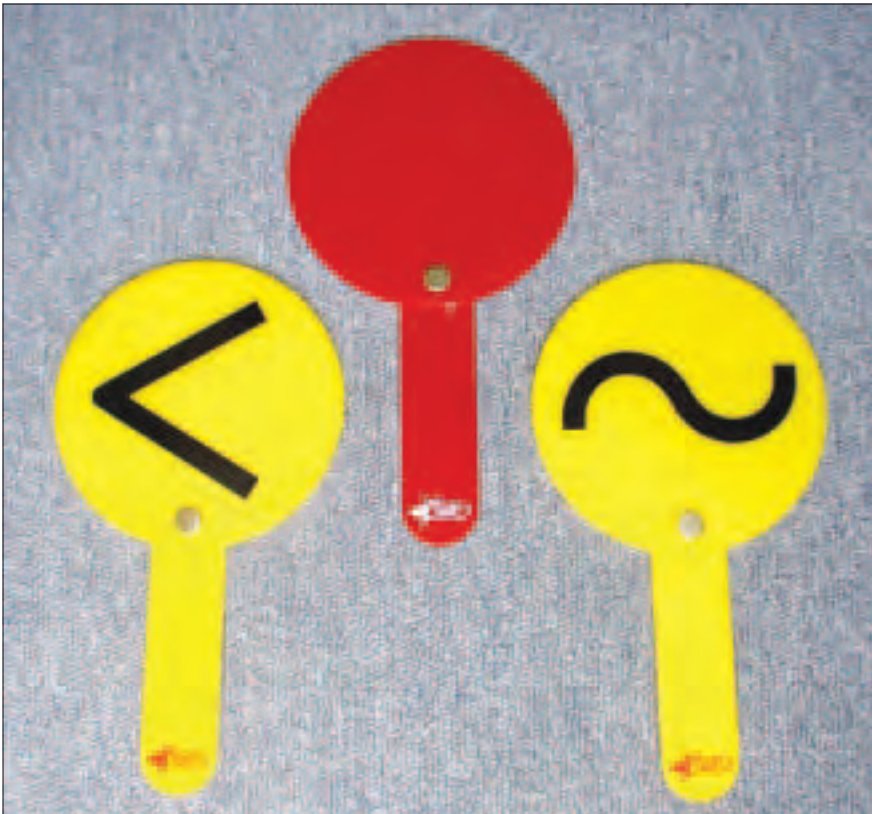
Paletas amarillas para los avisos y roja para las descalificaciones