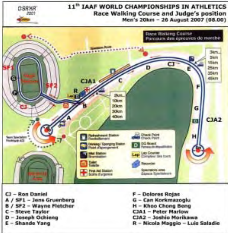
IAAF World Championships, Osaka 2007. Map of the circuit and road judging position