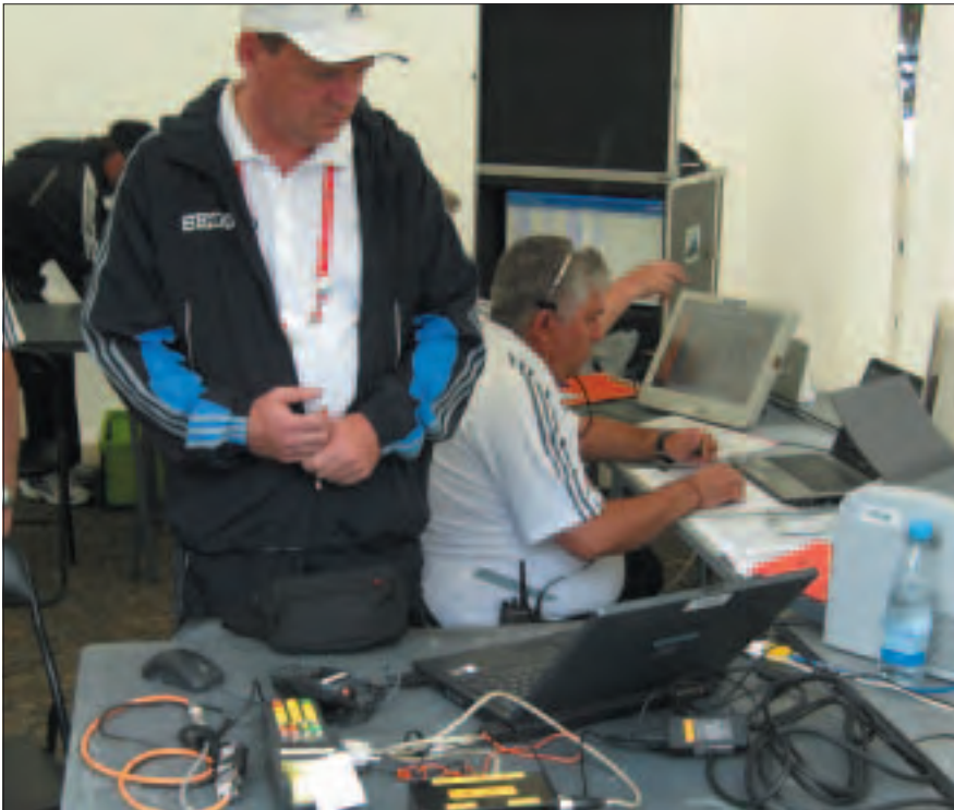
Recorders area at the IAAF World Championships - Berlin, 2009

The Judging Summary sheet is the official score sheet of the judging of the race. ACCURACY IS ESSENTIAL. At the end of the race, the individual Judges' record cards are collected and all the cautions and red cards are added to the Judging Summary Sheet. It is important to indicate the time that each red card was issued and where applicable the time that any competitor was disqualified. The Judging Panel should receive a copy of the Judging Summary Sheet. In addition the Summary Sheet should be distributed to other relevant people such as Technical Delegate, LOC, Media through the TIC.