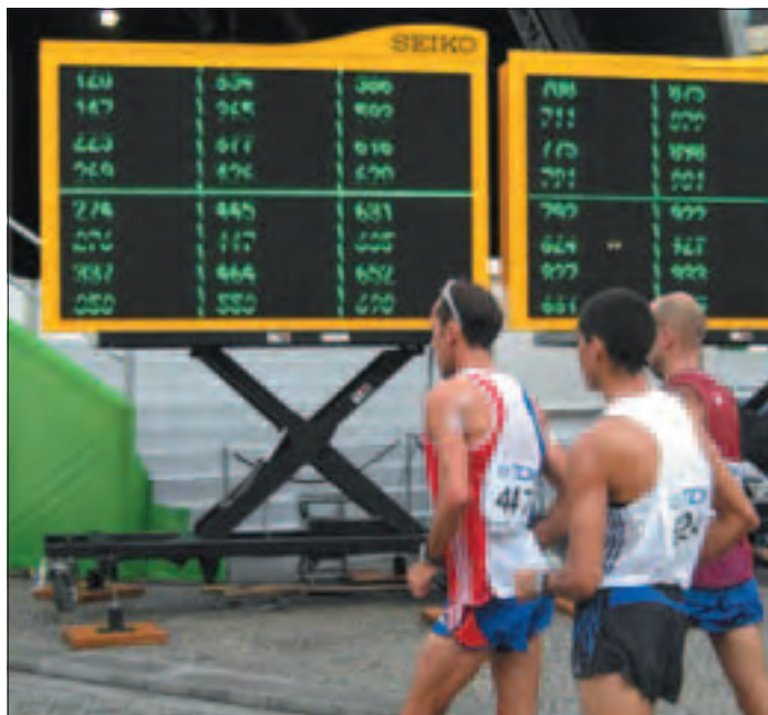
Tableau de report des cartons rouges, Berlin 2009.