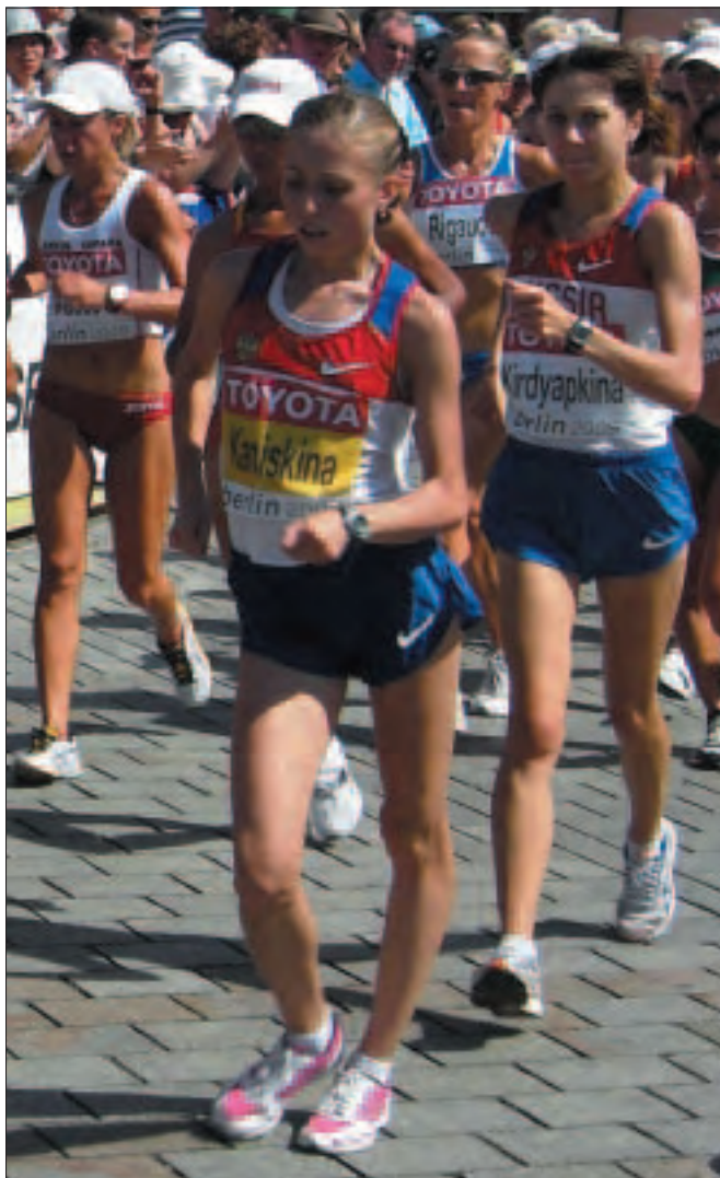
Olga Kaniskina (Rusia), Campeona Olímpica 2008, Campeona del Mundo 2007-2009.

Nuestros agradecimientos son también para los miembros del Comité de Marcha de la IAAF que han contribuido con sus útiles comentarios y consejos. Esta guía ayudará a mejorar los estándares para jueces, así como mejorar las competiciones y la disciplina deportiva de la marcha en todo el mundo.