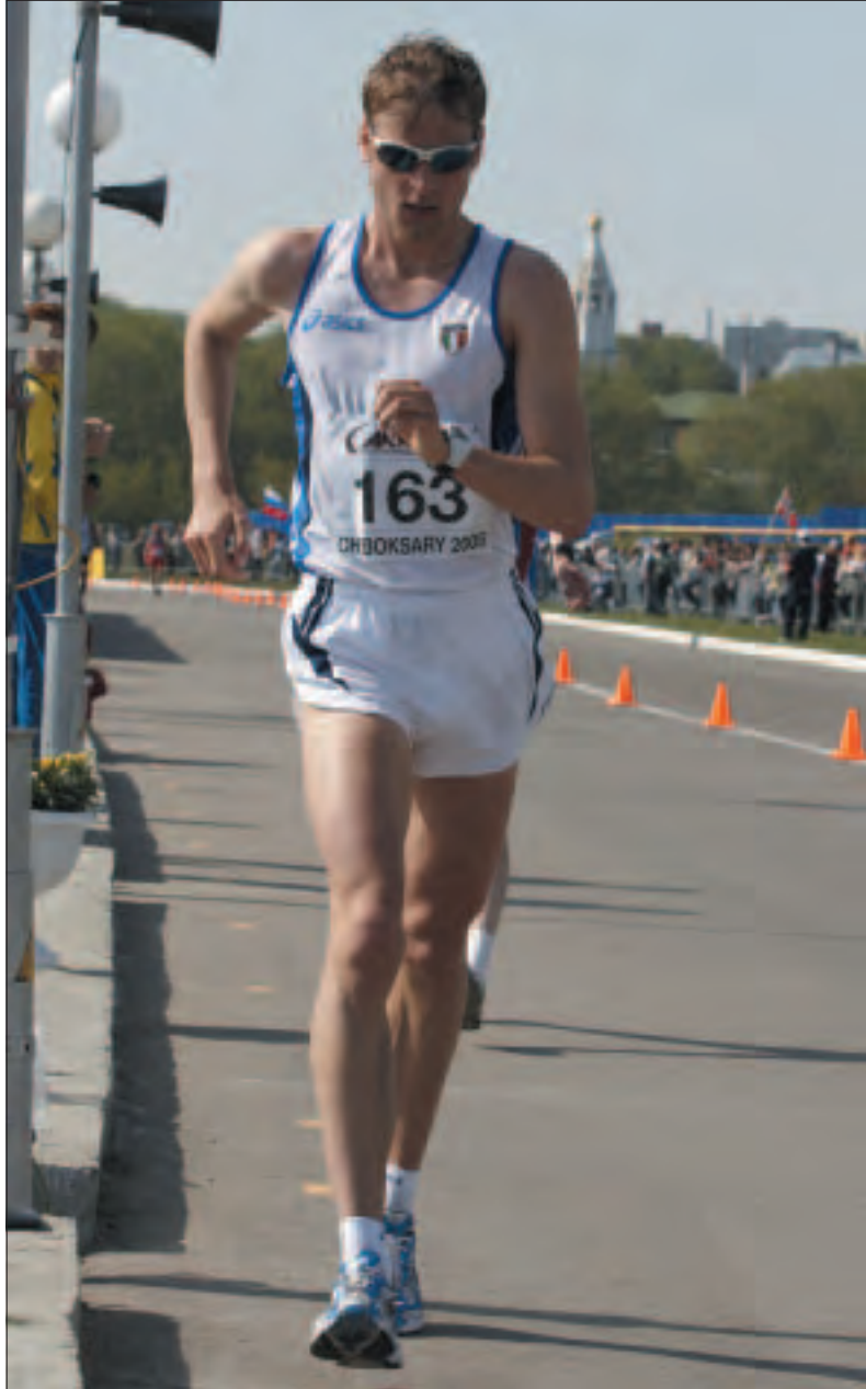
Alex Schwazer (Italy), Olympic champion 2008