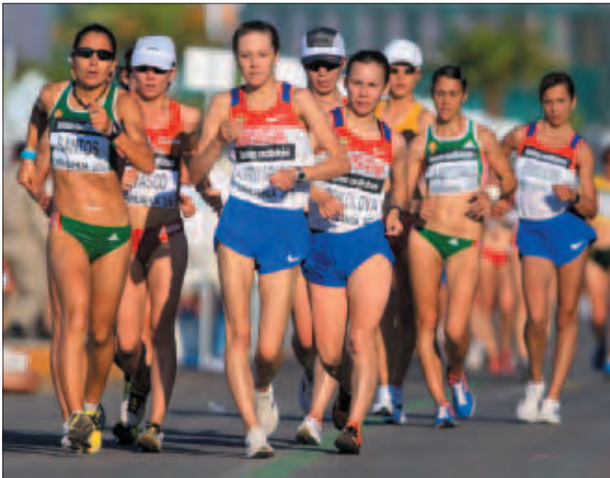
IAAF Copa del Mundo de Marcha 2010 - Prueba femenina