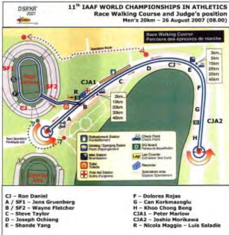
IAAF Campeonato del Mundo, Osaka 2007. Plano del circuito de marcha y posiciones de los jueces.