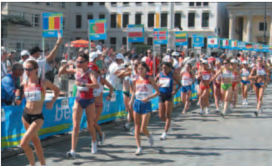
Poste de rafraîchissement aux Championnats du Monde de Berlin 2009. (Photo Maurizio Damilano).

d'avoir des éponges de taille moyenne trempées dans des seaux d'eau et placées sur des tables de 1m de haut pour être d'accès facile pour les marcheurs. Selon la règle 230.9, les ravitaillements, qui peuvent être fournis par le Comité d'Organisation ou par les athlètes, seront placés sur des tables identifiées avec le nom du pays des athlètes (ou les 3 lettres code). Ils seront placés de façon à être d'accès facile, ou ils peuvent être mis dans les mains des concurrents par un personnel autorisé. Des officiels d'athlétisme devraient être désignés pour superviser les postes de ravitaillement et s'assurer qu'au maximum deux personnes de chaque pays sont placées derrière chaque table de ravitaillement. En aucun cas une personne n'est autorisée à courir à côté des marcheurs pour donner le ravitaillement. Le personnel doit faire attention de ne pas gêner les marcheurs lorsqu'il ramasse les bidons etc. jetés sur le parcours.