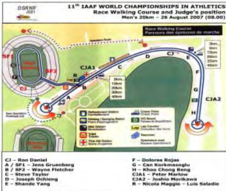
Plan du Circuit et positions des juges sur route. Championnats du Monde d'Athlétisme d'Osaka, 2007.