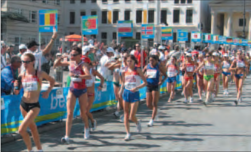
Refreshment Area at the World Championship in athletic, Berlin 2009.

ers can then simply swing by the tables and seize the cups. Attendants keep the cups full and remove discarded cups from the course. A large trash barrel should be used to dispose of used cups. The best arrangement for the sponging station(s) is to have medium size sponges taken from large buckets of water by attendants and placed on tables approximately 1 metre high for easy reach by the walkers.