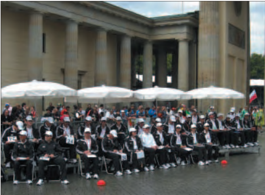
Lap counters officials at the World Championship, Berlin 2009.

These people will be responsible for the operation of the Posting Board during