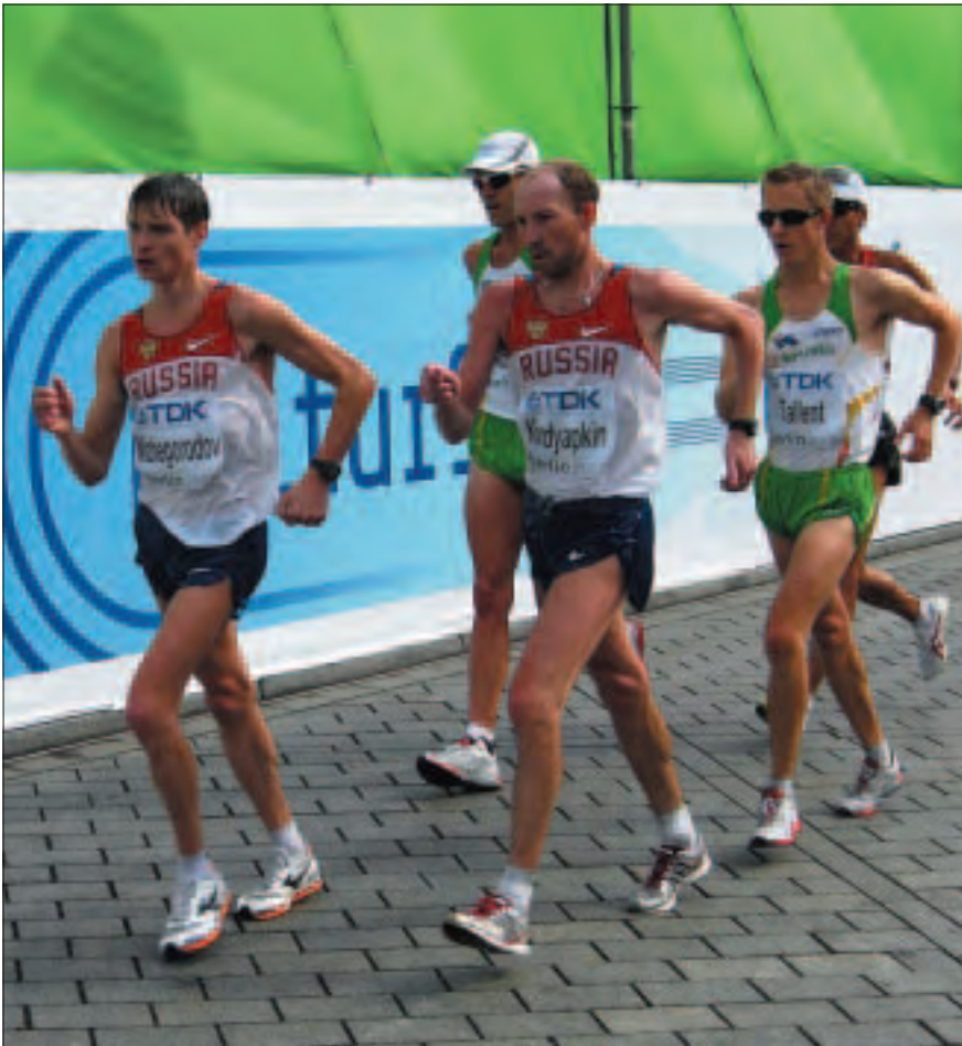
Grupo de cabeza en la prueba de 50km del IAAF Campeonato del Mundo - Berlín 2009.