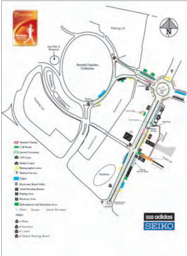
Plano del circuito de la IAAF Copa del Mundo de Marcha, Chihuahua 2010.